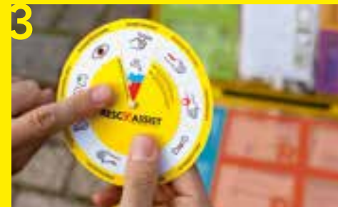
3 Wer den Pfeil auf der Drehscheibe zum Icon der Verletzung bewegt, sieht Farbfelder und Maßnahmen