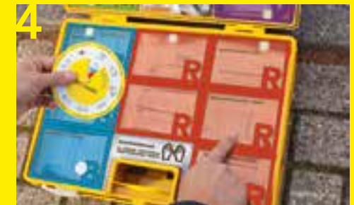
4 Die Farben der Felder leiten den Helfer zu farbi- gen Fächern mit den richtigen Hilfsmitteln