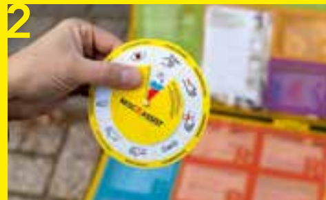
2 Auf der Drehscheibe erkennt man die Icons der verschiedenen Verletzungstypen