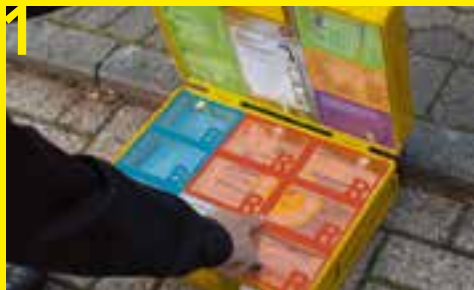
1 Sofort beim Öffnen des Koffers erblickt der Ersthelfer die hilfreiche Resc-Q-disk